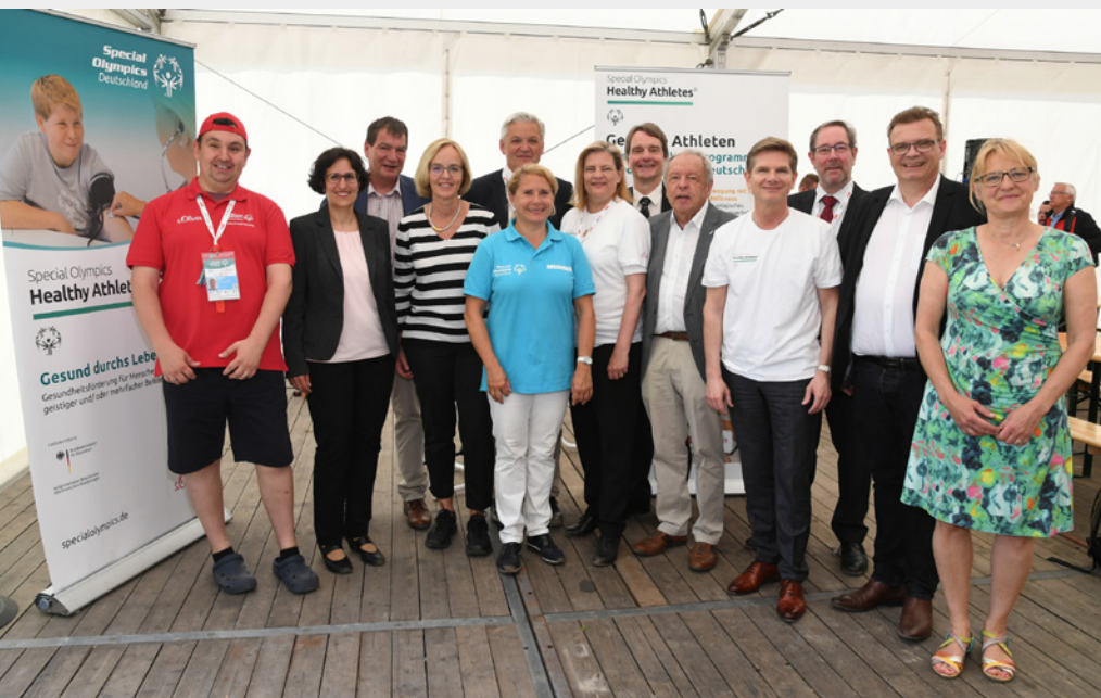
Foto: Eröffnung des Healthy Athletes Programms bei den Special Olympics in Kiel

soll auf diesem Wege ein psychotherapeutisches Betreuungsnetzwerk in Deutschland aufgebaut werden und damit der Zugang zur psychotherapeutischen Versorgung für alle Menschen mit geistiger Behinderung in Deutschland verbessert werden.