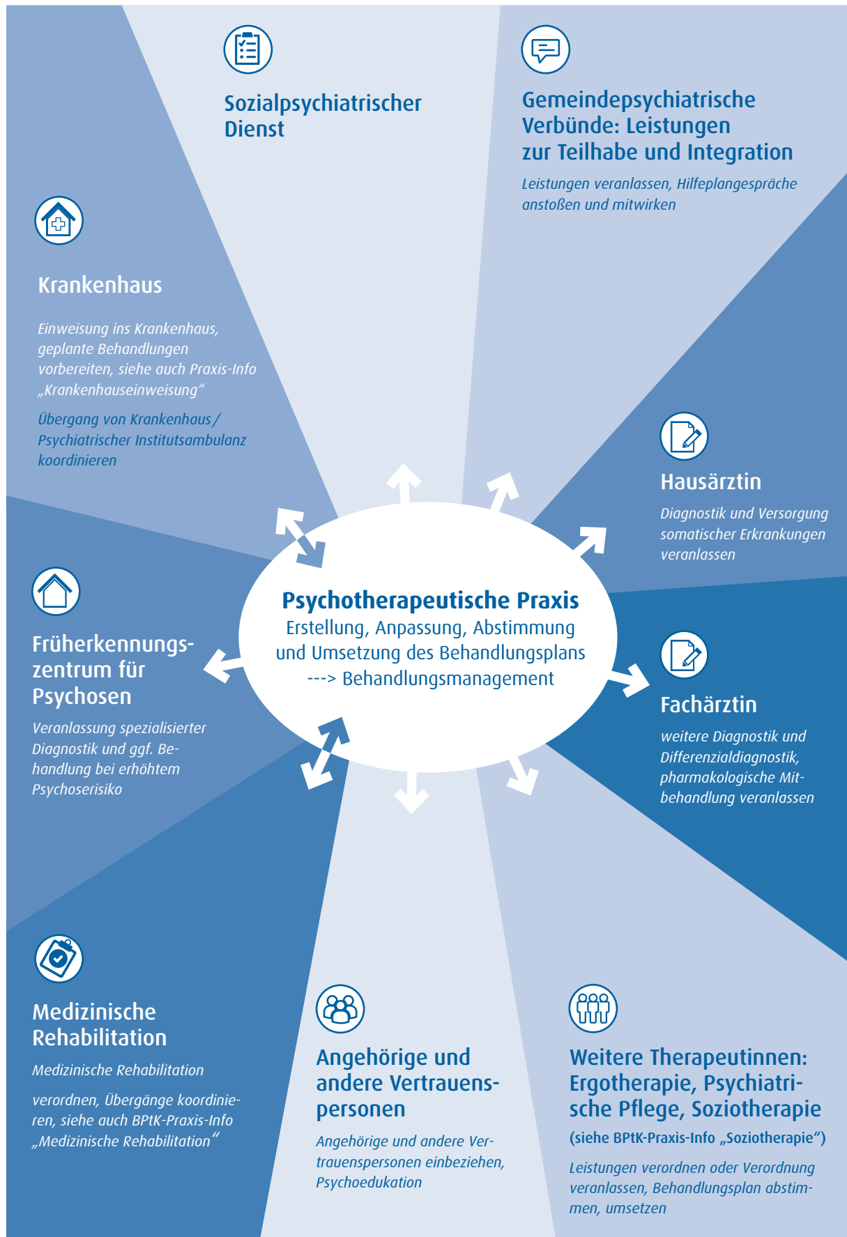
Abbildung 3: Versorgungskoordination in der Behandlung von Menschen mit Schizophrenie